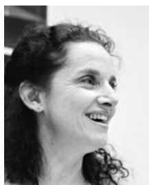
Emmanuelle Haïm Direction musicale

Véritable championne du répertoire baroque, Emmanuelle Haïm est mondialement acclamée à la fois comme instrumentiste et cheffe d'orchestre. En 2000 elle fonde Le Concert d'Astrée, avec lequel elle se produit sur les scènes des plus grandes maisons d'opéra internationales en collaboration avec des metteurs en scène de renom tels que Mariame Clément, Christof Loy, Robyn Orlin, Barrie Kosky et Guy Cassiers. Les nombreux enregistrements du Concert d'Astrée, dont le Rodelinda de Haendel mis en scène par Jean Bellorini (DVD, 2018), sont distingués par plusieurs prix. Emmanuelle Haïm dirige aussi des orchestres modernes tels que le Royal Concertgebouw, le London Symphony, les Berliner et Wiener Philharmoniker, les Los Angeles et New York Philharmonic. Elle est chevalier de l'ordre national de la Légion d'honneur, officier des Arts et des Lettres et membre honoraire de la Royal Academy of Music.